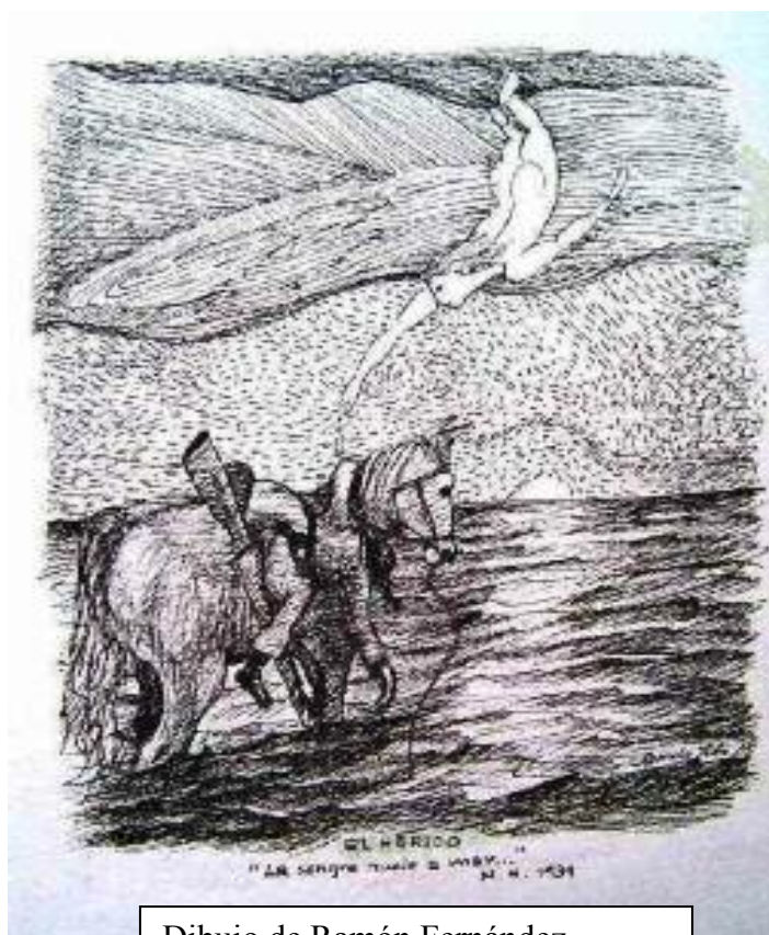
Dibujo de Ramón Fernández. “El herido”-2

mitificó sin duda a Miguel Hernández, agigantando desmedidamente su figura)»[4]. Sus poemas aparecieron en todos los romanceros de la guerra civil, revistas y periódicos como una forma de propaganda, como un «modelo revolucionario» de campesino para plagiar. Su nombre se encuentra en los libros más destacados de la época como Romancero de la guerra civil española (1936), de la sección de publicaciones del Ministerio de Instrucción pública (nov.1936), en Romancero general de la guerra de España (1936), en Poetas de la España Leal , Ediciones Españolas. Madrid-Valencia, 1937, en Versos en la Guerra (1938) Socorro Rojo de Alicante [5]. En revistas de gran tirada como El Mono Azul de la Alianza Intelectuales Antifascistas, o el Altavoz del Frente Sur , y otras más que no podemos enumerar en este espacio.